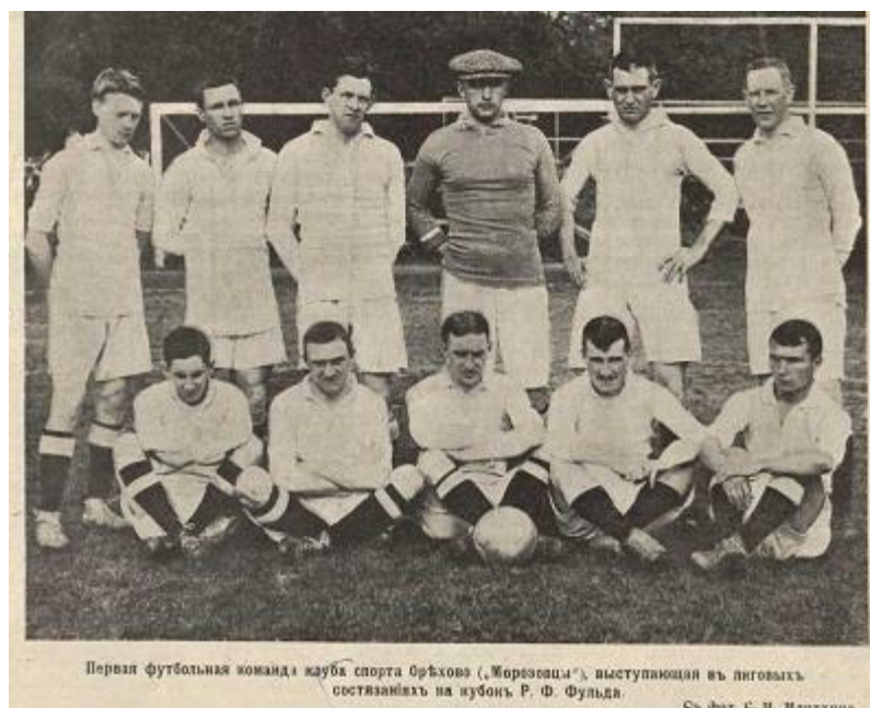
Первая футбольная команда клуба спорта Орского («Железники»), выступающая в лиговых состязаниях на футбол Р. Ф. Фульда.