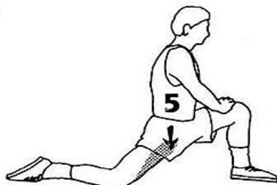
10-15 секунд для каждой ноги