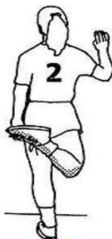
10 секунд для каждой ноги