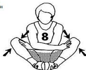
10 секунд для каждой руки